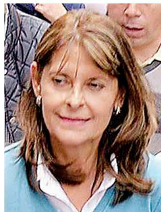
Marta Lucía Ramírez, Partido Conservador.