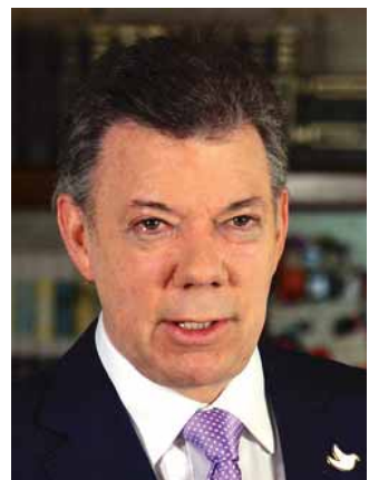
Juan Manuel Santos, Partido de la U