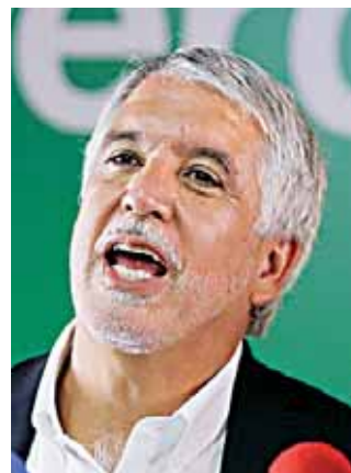
Enrique Peñalosa, Partido Alianza Verde.

teado por el analista, al afirmar que en la primera vuelta el voto en blanco capitalizaría el 12% de la preferencia en la primera vuelta y un 20% para la segunda vuelta.