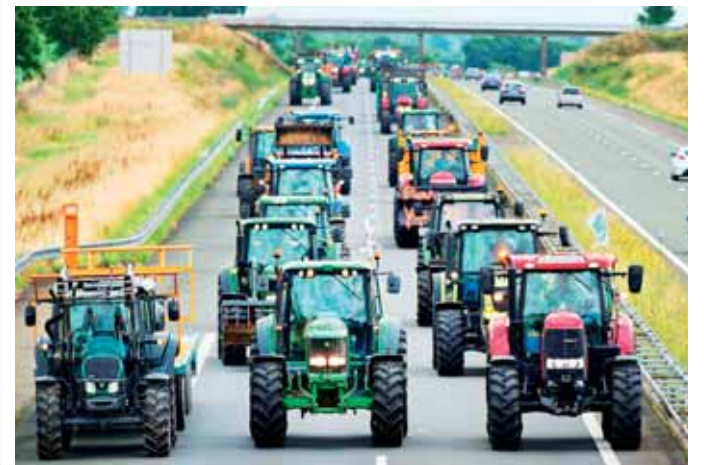
Los productores agropecuarios bloquearon con sus tractores una vía principal en el norte de Francia.