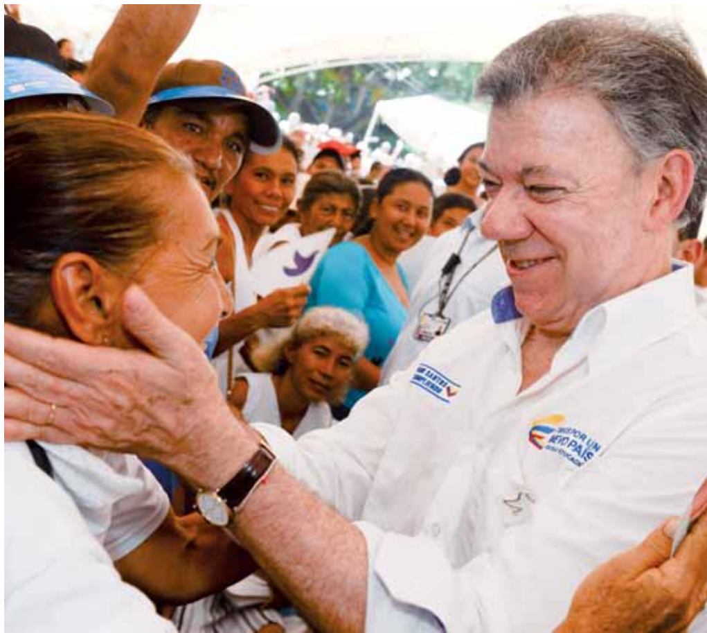
El jefe de Estado colombiano participó este lunes en un evento de inclusión social en el departamento de Sucre, norte de Colombia.

Por otra parte, el periódico El Tiempo se hizo eco de las